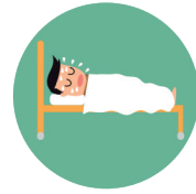
Djersitje të natës