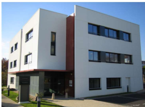
Cabinet de pneumologie et d'allergologie

Nous sommes quatre pneumologues libéraux installés à Saint Nazaire-La Baule, à 45 minutes de Nantes, dans un environnement de bord de mer très agréable. Nous cherchons à étoffer notre équipe du fait d'une forte activité. Nous vous proposons des remplacements, en vue d'une association à temps plein, partiel ou d'une collaboration.